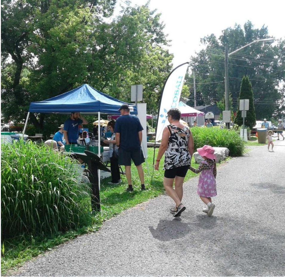
Kiosque du COBALI - Fête du Nautisme – Gatineau (secteur Buckingham)